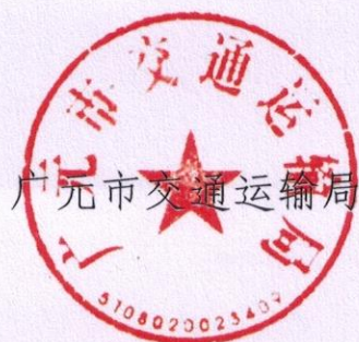
广元市交通运输局