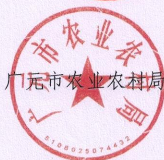
广元市农业农村局