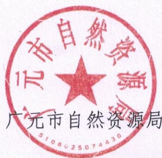
广元市自然资源局