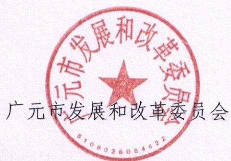
广元市发展和改革委员会

广元市发展和改革委员会同相关招标投标行政监督部门负责解释，自印发之日起30日后施行，有效期5年。