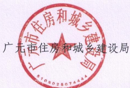
广元市住房和城乡建设局